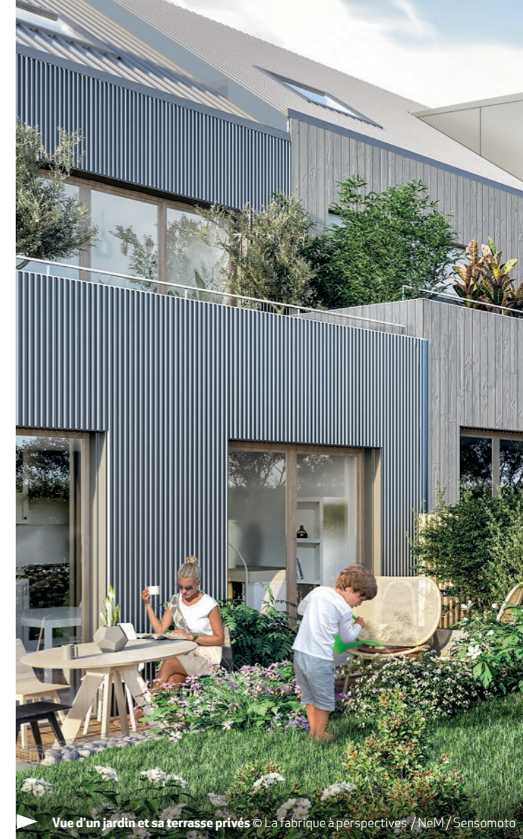
Vue d'un jardin et sa terrasse privés

La qualité paysagère est travaillée avec finesse. Riche et variée, la végétation sera issue majoritairement d'espèces locales d'Île-de-France.