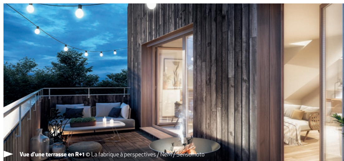
Vue d'une terrasse en R+1