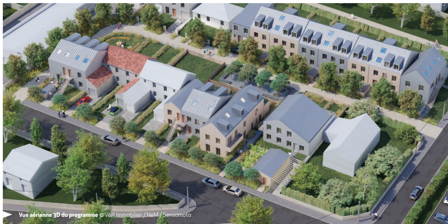
Vue aérienne 3D du programme