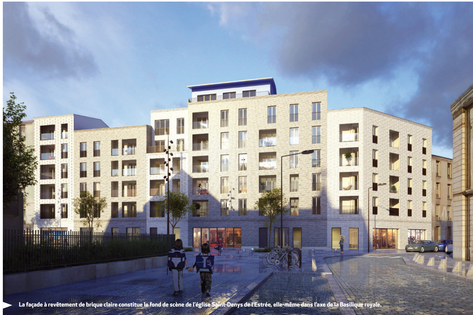
La façade à revêtement de brique claire constitue le fond de scène de l'église Saint-Denys de l'Estrée, elle-même dans l'axe de la Basilique royale.