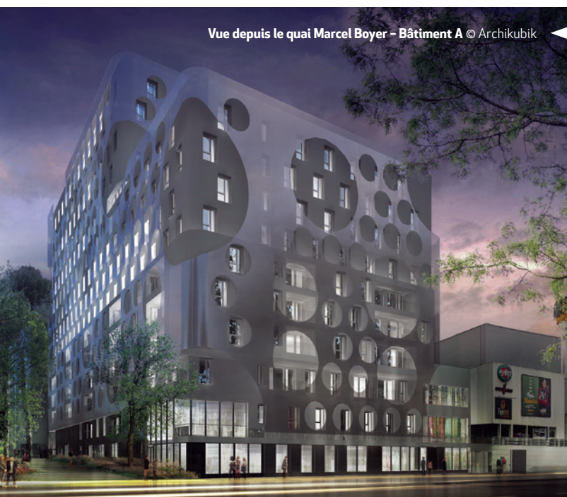
Vue depuis le quai Marcel Boyer - Bâtiment A © Archikubik