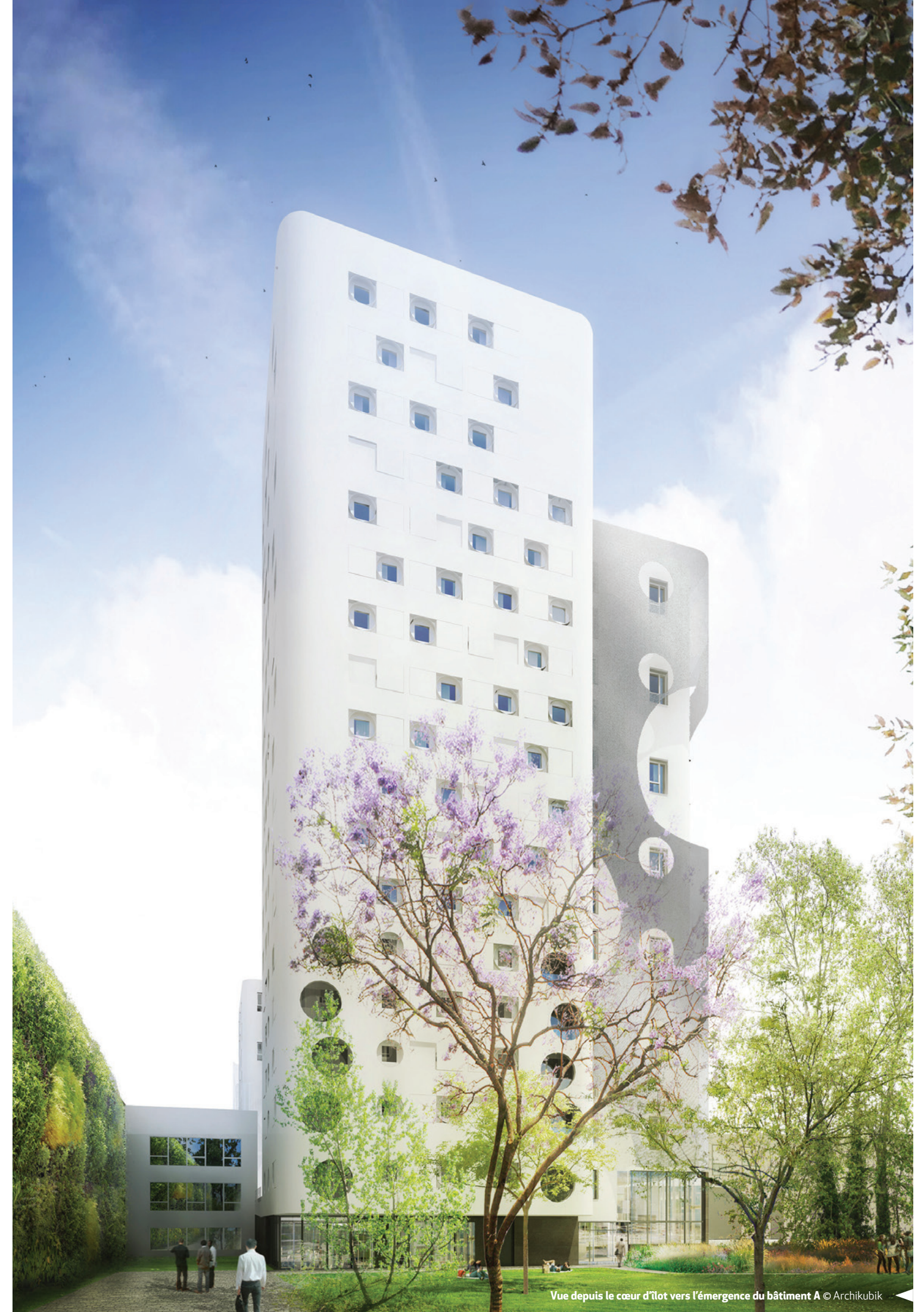
Vue depuis le cœur d'îlot vers l'émergence du bâtiment A

Sur le plan social et économique, l'installation de l'hôtel et des résidences gérées participe au renforcement de l'attractivité du quartier en créant 120 à 150 emplois dont 40 à 50 emplois directs.