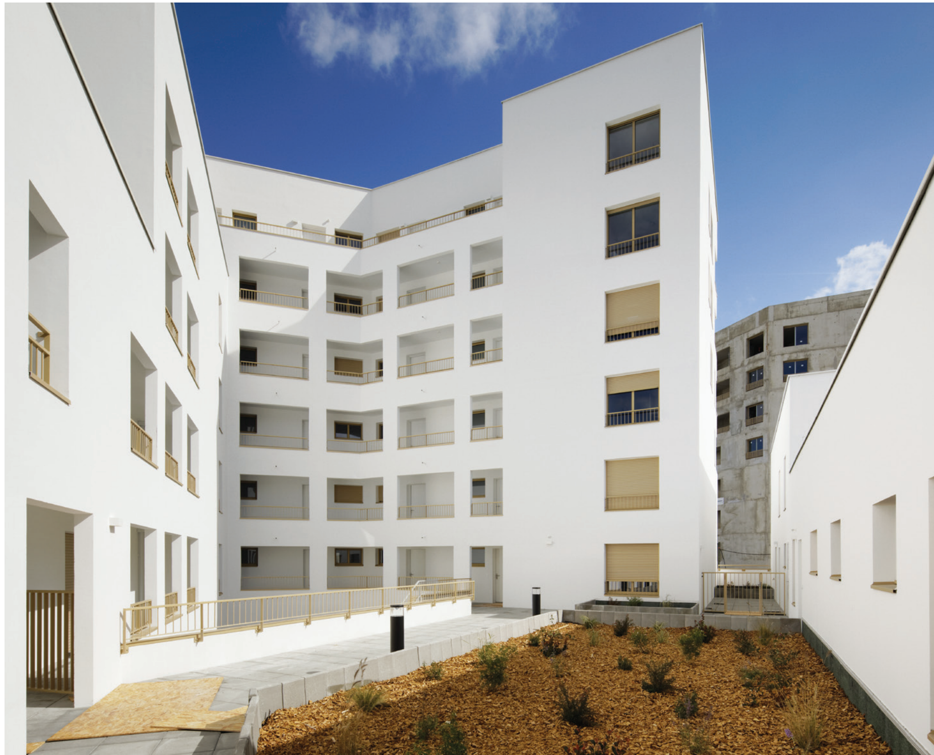
► Vue du cœur d'îlot du premier bâtiment livré