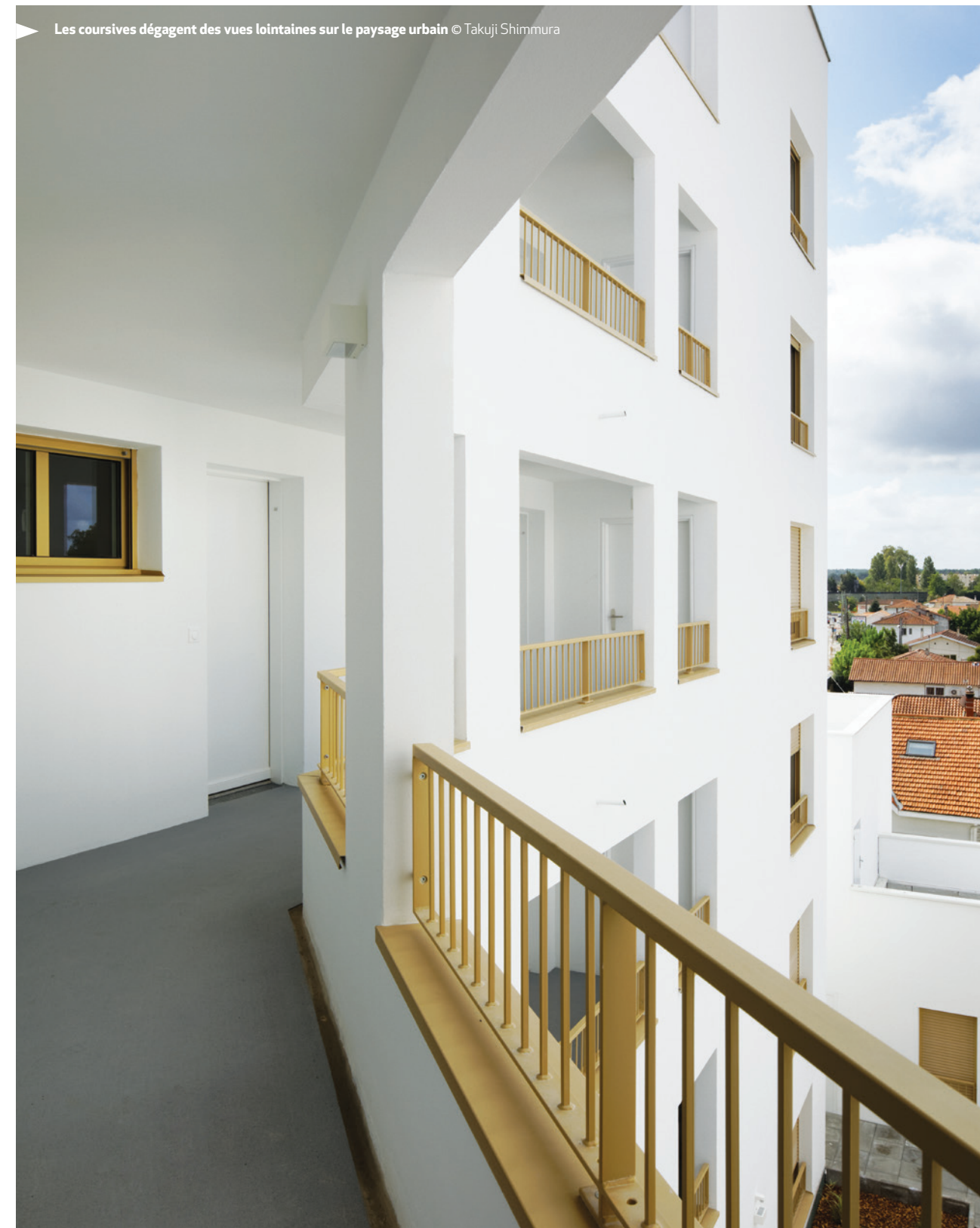
► Les coursives dégagent des vues lointaines sur le paysage urbain

Le déplacement de la place Aristide Briand dégage dans son emprise actuelle un lot à bâtir jouant le rôle particulier de fond de place. Dans sa géométrie complexe assurant transition avec les pavillons qui lui font face, il organise la desserte des logements par des coursives offrant des vues sur les lointains. Ce bâtiment pour Gironde Habitat est le premier livré de l'opération.