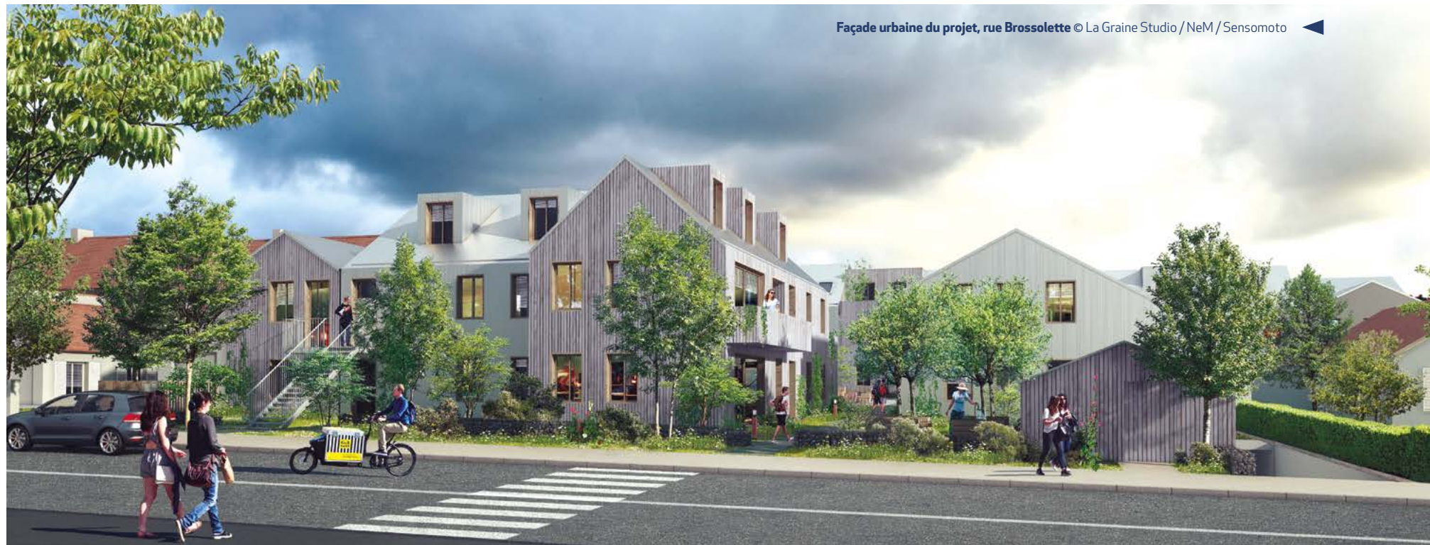
Façade urbaine du projet, rue Brossolette © La Graine Studio / NeM / Sensomoto

Le programme s'articule autour du passage des Aulnettes, totalement requalifié et agrémenté d'une placette au bénéfice de tous ses riverains, en particulier des enfants. Le parking souterrain accessible depuis la rue Pierre Brossolette libère le passage des Aulnettes de l'essentiel du flux de circulation. Ce passage, dévolu aux mobilités douces, voit sa largeur réduite pour laisser place à une vaste noue paysagère, support de biodiversité enrichie et de gestion autonome des eaux pluviales. La végétation mise en place sera issue majoritairement d'espèces locales d'Île-de-France et/ou adaptées aux évolutions climatiques afin d'assurer la pérennité du paysage de l'opération.