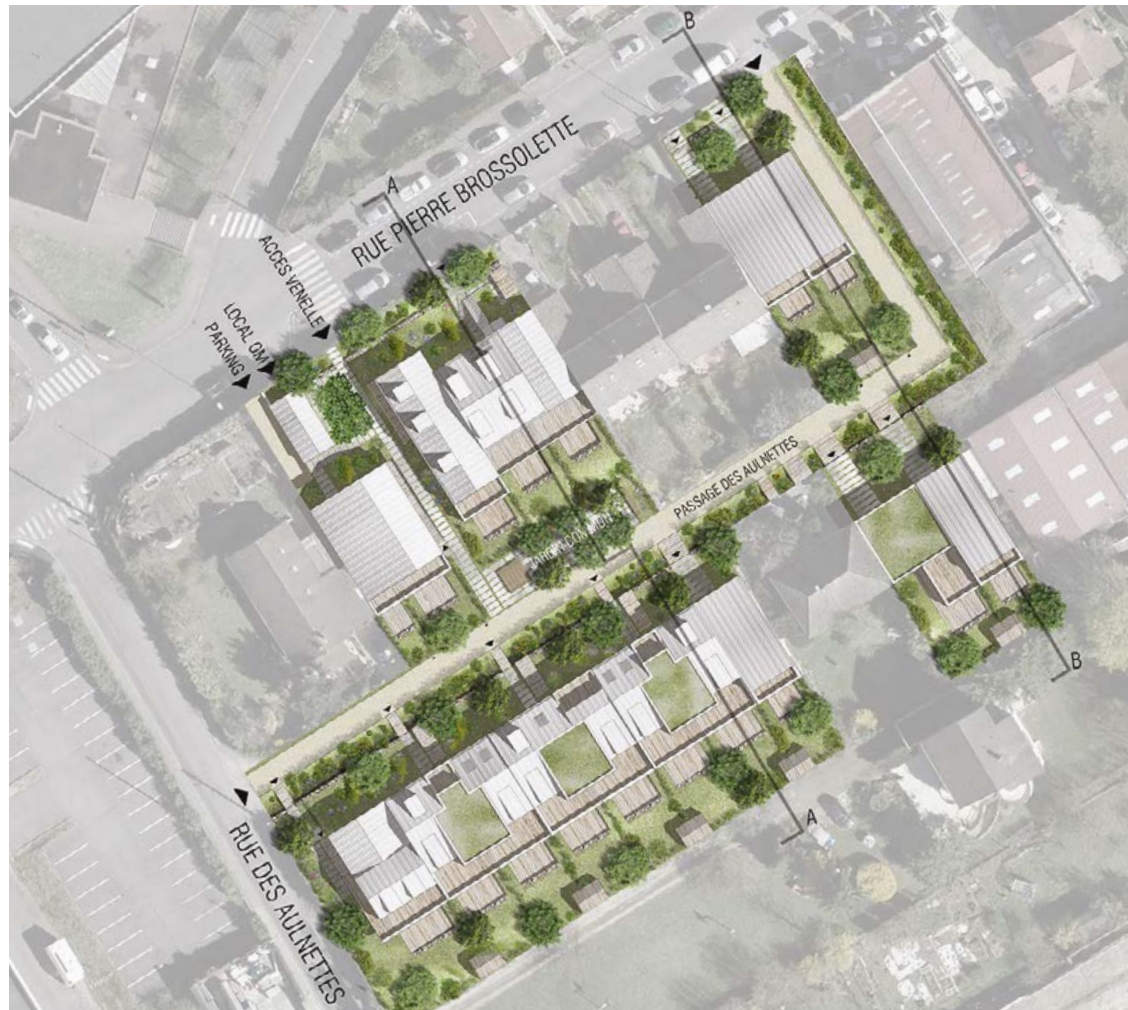
► Plan masse du projet : une insertion douce dans le quartier © NeM / Sensomoto